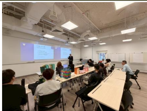
描述:雙方教授互相介紹各自的學校