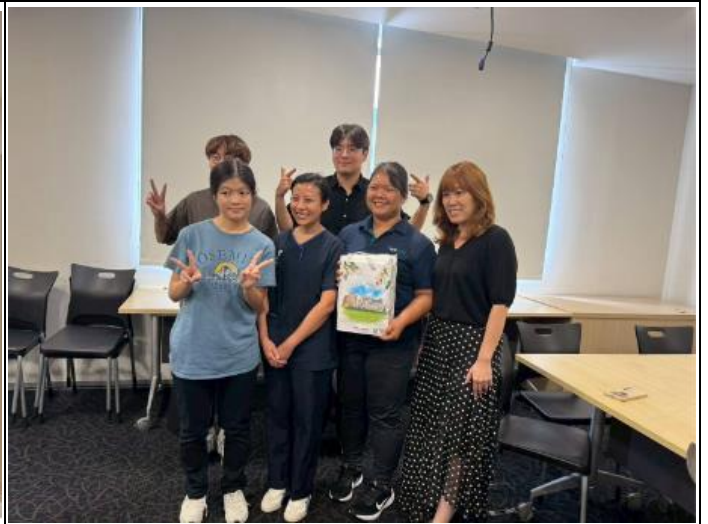
描述:與陳篤生醫院的語言治療師合影