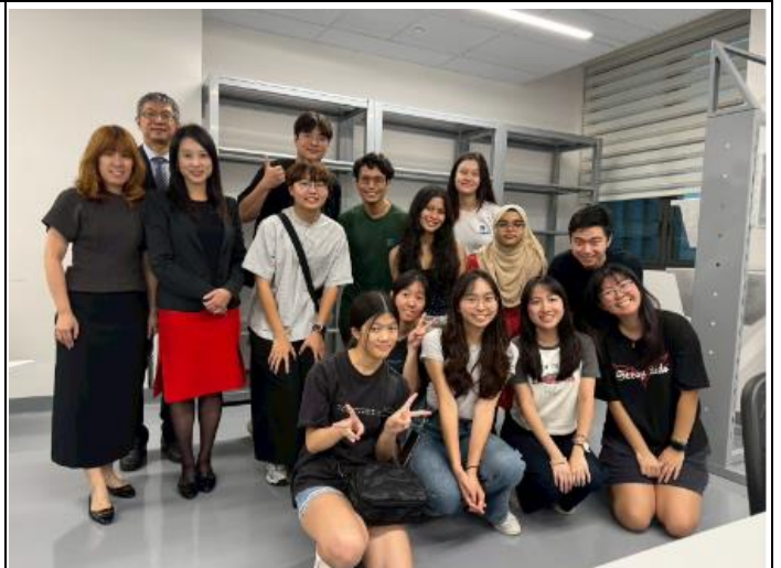
描述:在職能治療系的專業教室(製作副木的教室)和新加坡理工大學的學生與物理治療老師合影