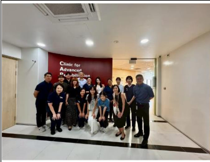
描述:與陳篤生醫院的治療師合影