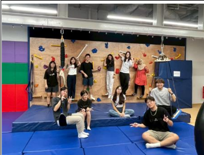
描述:在職能治療系的專業教室(感統教室)和新加坡的職能治療以及語言治療學生合影