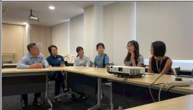
描述:在與陳篤生醫院的會議中簡單的自我介紹