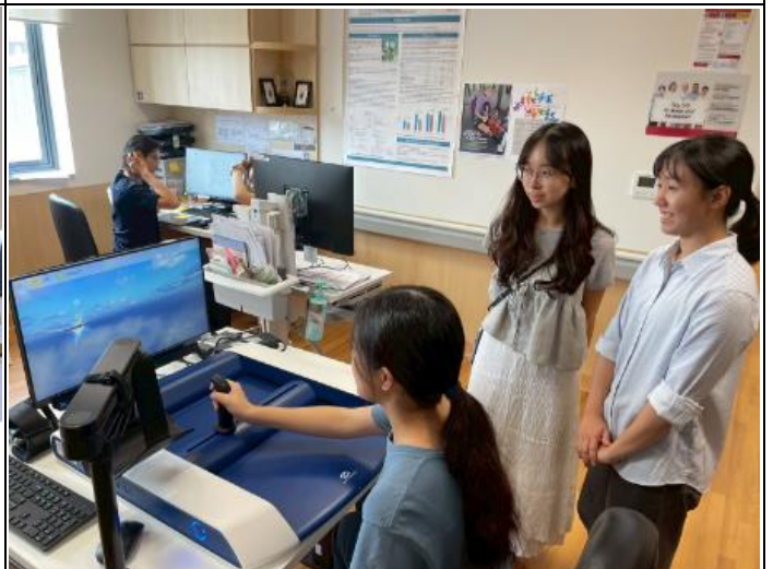
描述:操作陳篤生醫院職能治療的儀器