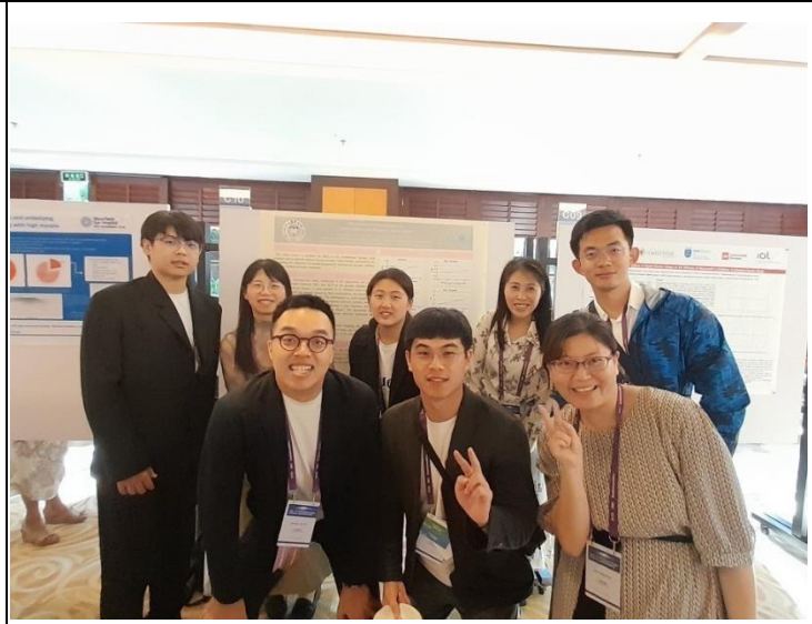
描述:與同行老師和同學在壁報展示前合影