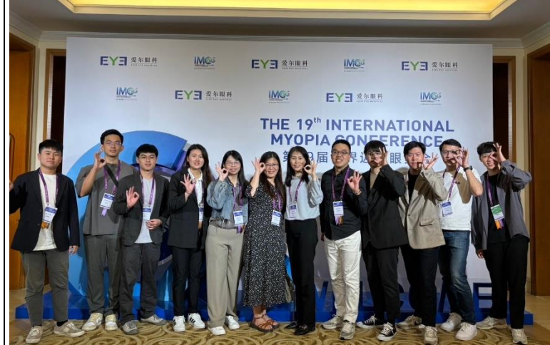
描述:參與 IMC 留影之三