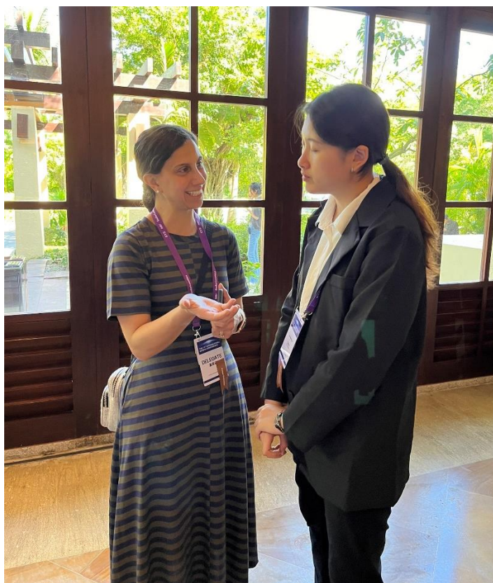
描述:我與外國學者交流