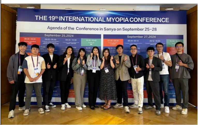
描述:參與 IMC 留影之二