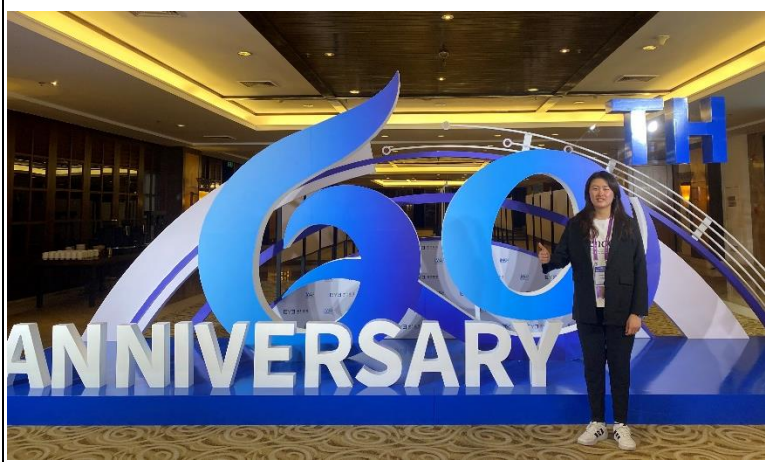
描述:參與 IMC 留影之一