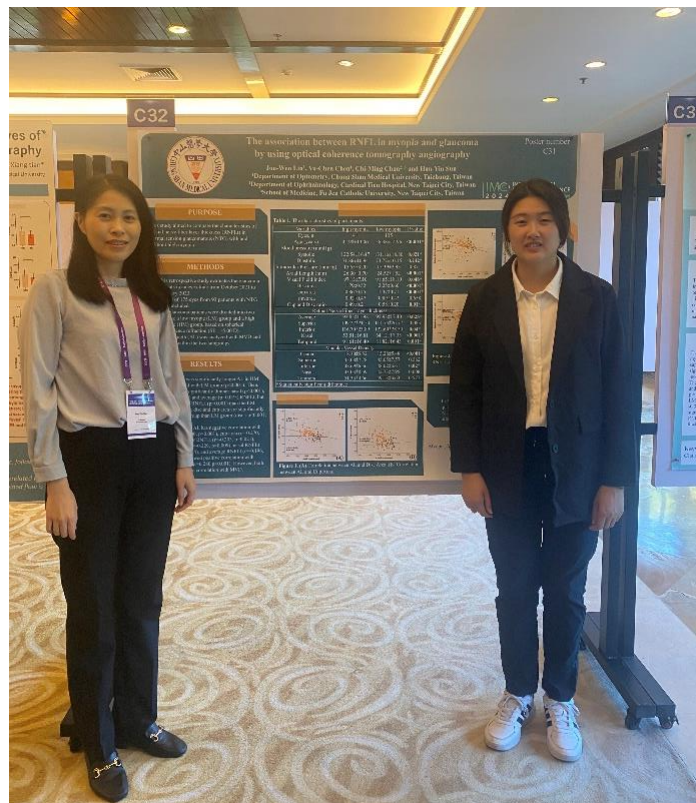
描述:我與指導教授和壁報合影