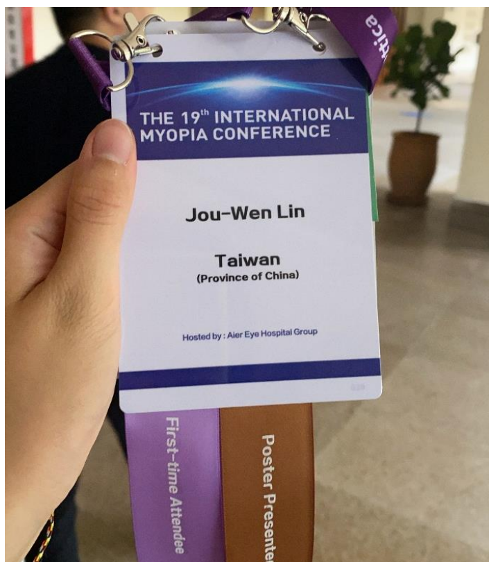
描述:國際近視大會參加名牌