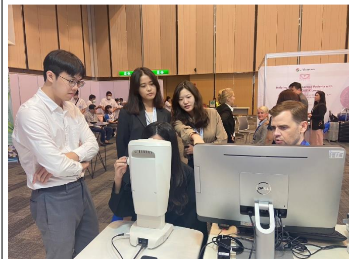
與國外儀器廠商交流心得並洽談合作機會