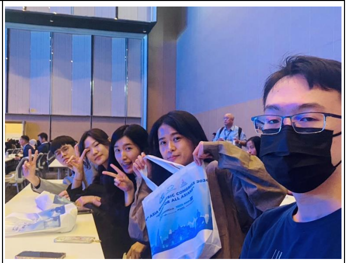
於演講會場聆聽報告