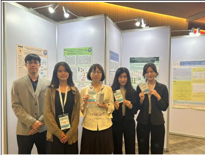
與指導教授及同學在海報前合影