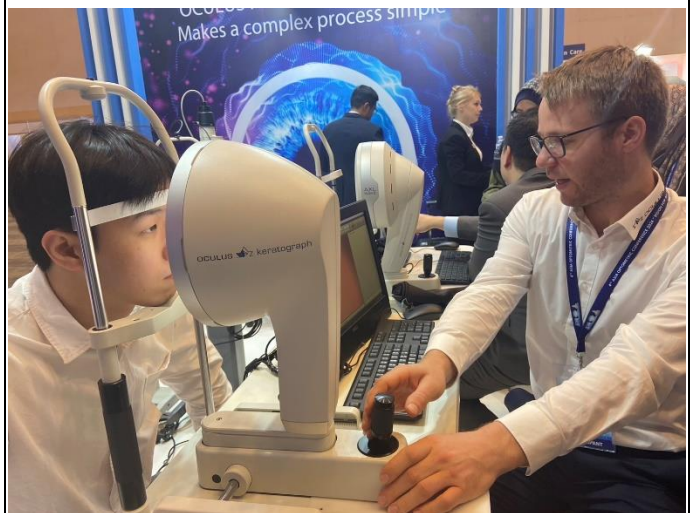
體驗新型儀器測量與產業未來趨勢