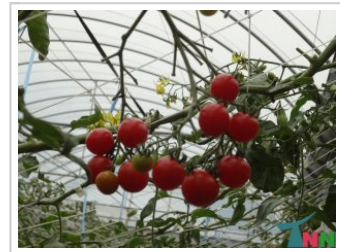
蕃茄種苗銷中 國內產量不足