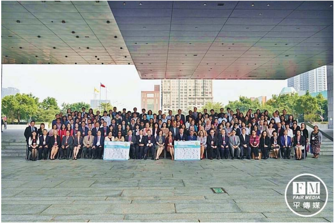
亞洲健康識能國際會議在台中，專家學者齊聚探討公衛議題。

辦「第六屆亞洲健康識能國際會議」，27日在市政大樓集會堂登場，來自30個國家、300多位專家學者齊聚探討公衛議題，亞洲健康識能學會評委並頒發