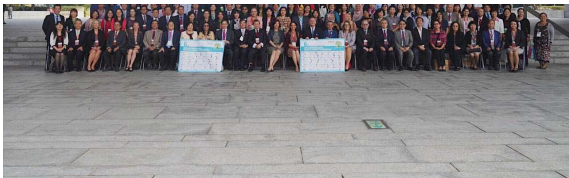
打造台中健康宜居城市 林佳龍獲頒首屆健康識能全球貢獻獎肯定