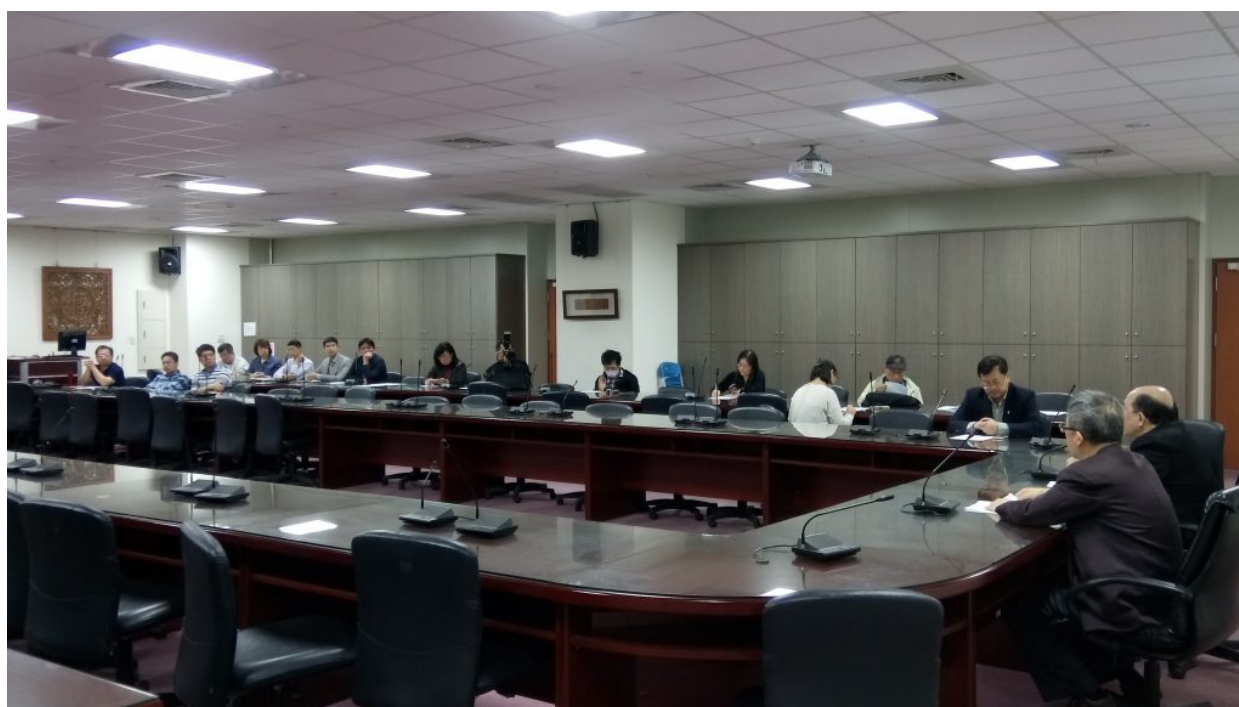
( http://www.lifedaily.tw/wp-content/uploads/2017/01/與會人員.jpg )