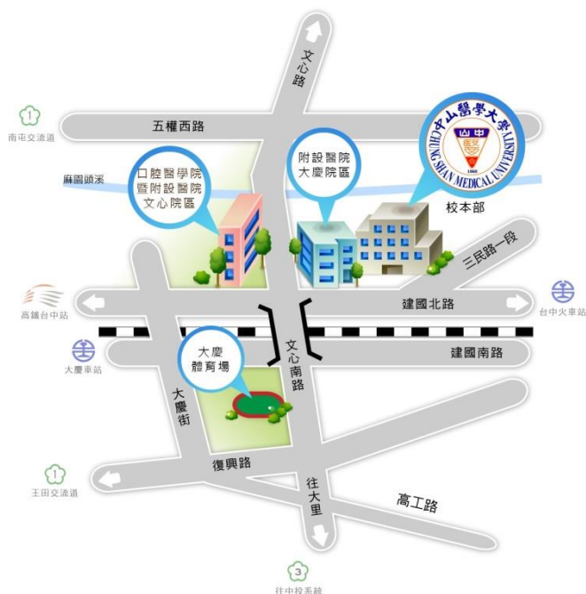
中山醫學大學位置

※搭乘公車:客運公車 53 號、73 號、159 號、800 號 於中山醫學大學站下車。