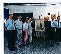
興大與科博館合辦蝴蝶展 百餘種 2019-10-31