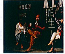
臺中國家歌劇院 阿喀郎 2019-10-24