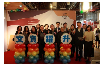
設計創新導入傳統工藝 文創實驗工場 2018-12-14

中山醫大附設醫院於12月11日舉辦工作強化中心成果發表，邀請勞動部職安署、台中市政府勞工局，一同見證服務職災勞工重返職場之成果。會中邀請兩位透過工作能力強化服務，成功返回職場復工之勞工，分享災後重建至復工之心路歷程，並感謝中山醫學大學工作強化中心及防治中心之團隊，提供專業且個別化之訓練，使勞工順利重返職場。